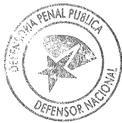
ANDRÉS MAHNKE MALSCHAFSKY DEFENSOR NACIONAL