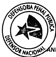
ANDRÉS MAHNKE MALSCHAFSKY DEFENSOR NACIONAL