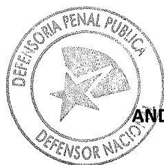
ANDRES MAHNKE MALSCHAFSKY DEFENSOR NACIONAL