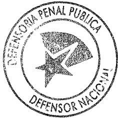
ANDRÉS MAHNKE MALSCHAFSKY DEFENSOR NACIONAL