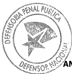
ANDRES MAHNKE MALSCHAFSKY DEFENSOR NACIONAL