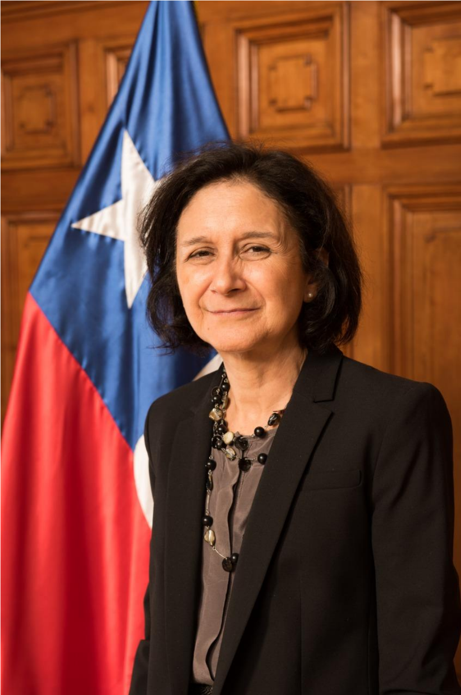
La ministra de la Corte Suprema Andrea Muñoz.

El fallo se convirtió en materia de estudio en varias escuelas de Derecho: la Sala Penal señaló que en este caso hubo discriminación por ser mujer y mapuche. Además, la Suprema aplicó el derecho internacional: la Convención Interamericana para prevenir, sancionar y erradicar la violencia contra la mujer (de Belén Do Pará).